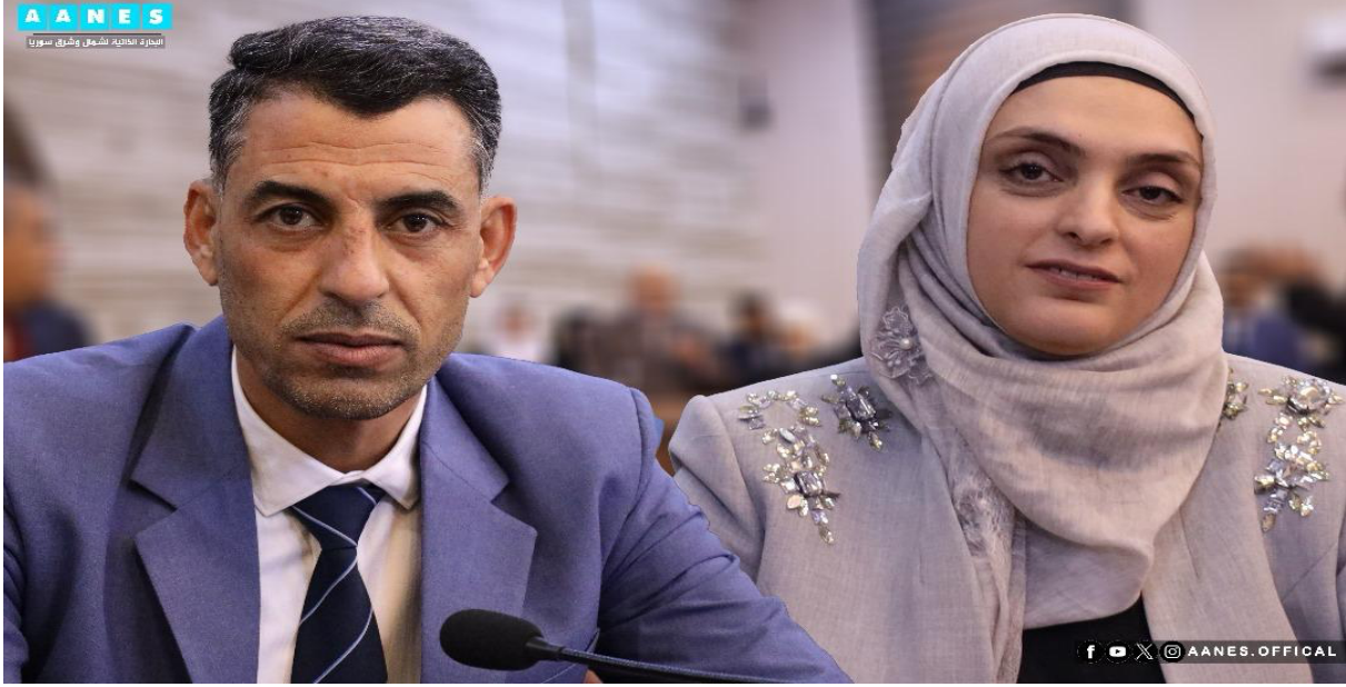
Şekil (1): Yüksek Seçim Kurulu Eş başkanları Rokn Mulla İbrahim (sağ) ve Hüseyin El Şeyh (sol)

El Şeyh ise 1984 doğumlu olup, Arap literatürü eğitimi sırasında okuldan atılmıştır. 2016 yılında örgütün kontrolüne geçen Sarrin bölgesinde, 'Kuzey ve Doğu Suriye Özerk Yönetimi' için çalışmaya başlamış ve uzlaşma komitesi başkanlığı yapmıştır.